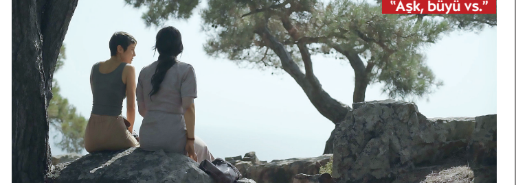
"Aşk, büyü vs."

Seattle Türk Film Festivali, 8. yılında 5-12 Aralık tarihleri arasında pandemi nedeniyle çevrimiçi olarak yapılacak. (Adres: https://www.stff.org/ https://nwfilmforum.org/events/seattle-turkish-film-festival-2020-online/ )